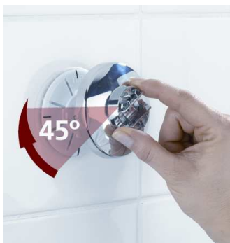
Aseta koukku-osa 45 asteen kulmassa imukupin päälle ja kierrä 45 astetta myötäpäivään.