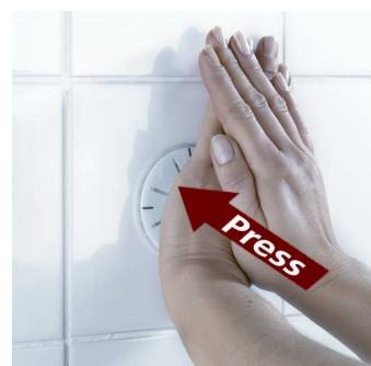
Paina voimakkaasti, jotta ilma puristuu ulos.