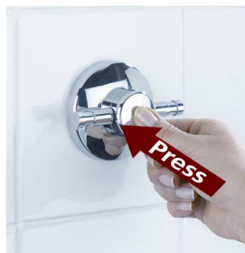
Paina pieni piilokiinnitysosa paikalleen.