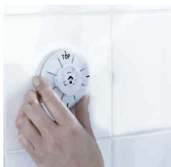
Aseta imukuppi paikalleen, ei sauman päälle.